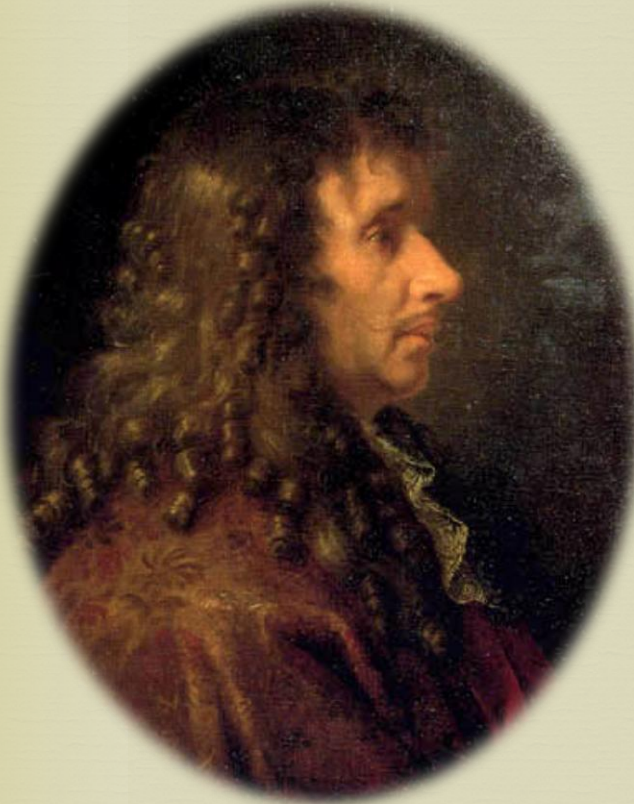
Le peintre-décorateur Charles Le Brun

Les trois artistes qui vont contribuer à faire de Vaux-le-Vicomte un château digne d'un roi: