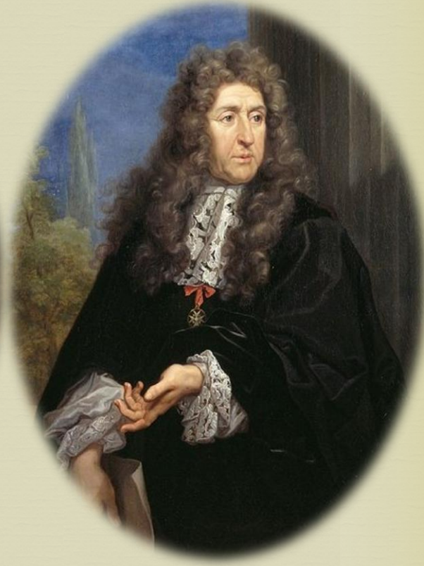
Le jardinier-paysagiste André Le Nôtre