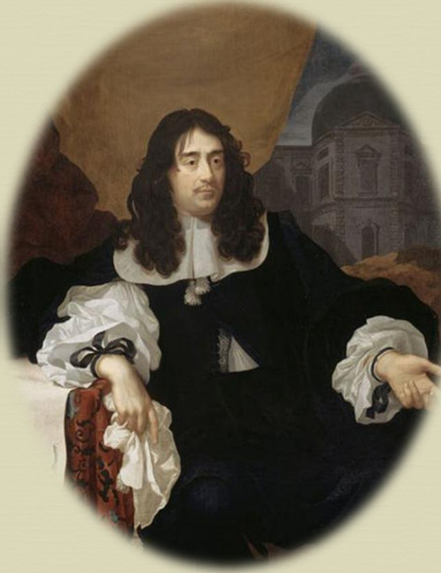
L'architecte Louis Le Vau